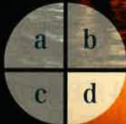
a: コスモ石油 b: JFE スチール東日本製鉄所(コークス) c: JFE スチール東日本製鉄所(ガントリークレーン) d: 富士山の夕景