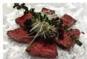
黒毛和牛イチボのたたき ¥780