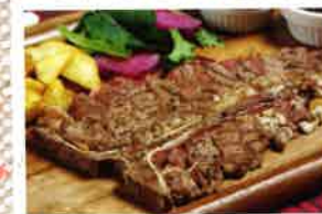
Tボーンステーキ (1g) ¥12