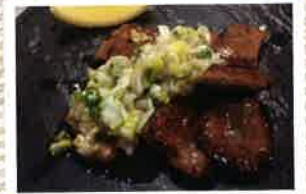
特上牛タンのグリル ¥1,200