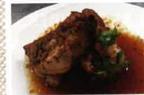
ガーリックスペアリブ ¥900