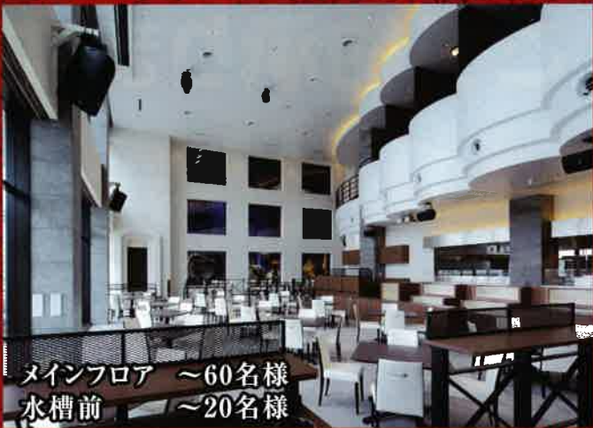
メインフロア ~60名様 水槽前 ~20名様