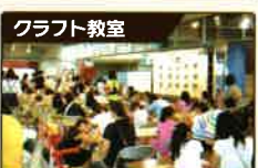
※他にも季節に合わせたイベントを随時開催。詳しくは公式ホームページでご紹介しています。