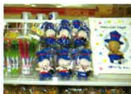
ぼーとくんグッズ