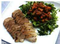
恋する豚のローストポーク

地上109mのオーシャンビューレストラン。美しい景色や夜景を眺めながらお食事を楽しむことができます。千葉県産の「恋する豚」と「野菜」や自家製ハーブを使ったbuffetスタイルのレストランです。