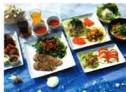
約50種類の創作料理