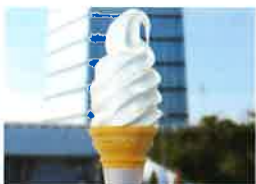
一番人気!ソフトクリーム

併設のコンビニエンスストアでは、お弁当や飲み物、お菓子のほか日用品も多数取り揃えています。また、福祉施設の製品、加工品もあります。